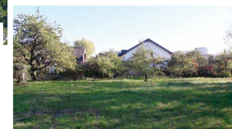
QR-Code scannen und auf Google Maps ansehen!