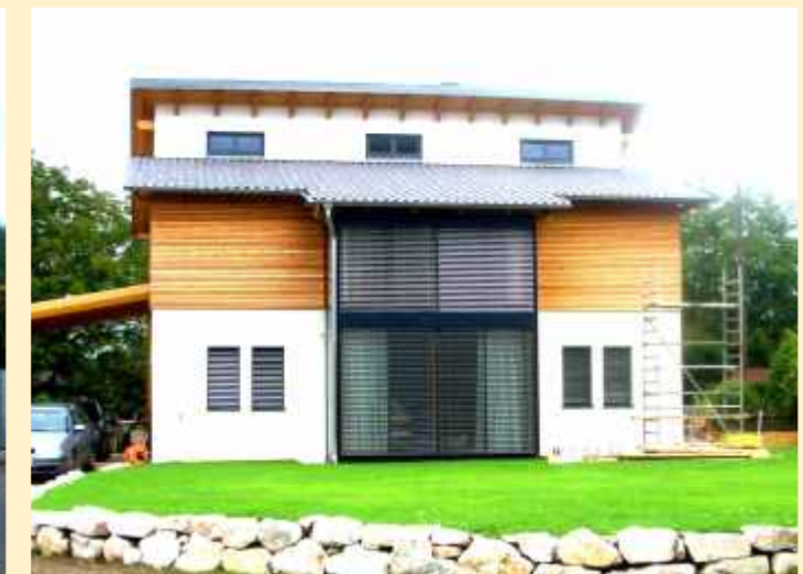
// EINE AUSWAHL REALISIERTER GEBÄUDE VON MY HOME: