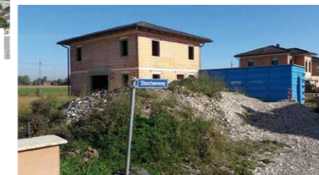
QR-Code scannen und auf Google Maps ansehen!

In einem ruhigen Siedlungsgebiet in Marchtrenk / Gimpelstraße, errichten wir für Sie eine Doppelhausanlage in Ziegelmassivbauweise! Um das Grundstück gibt es eine gute Infrastruktur!