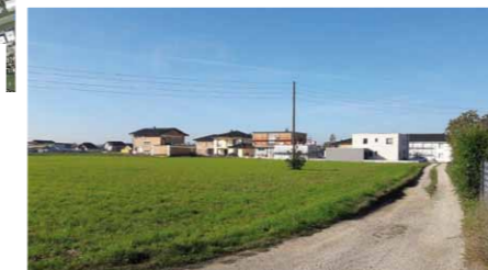
QR-Code scannen und auf Google Maps ansehen!