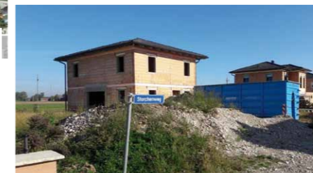
QR-Code scannen und auf Google Maps ansehen!