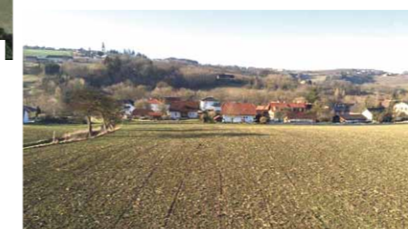
QR-Code scannen und auf Google Maps ansehen!