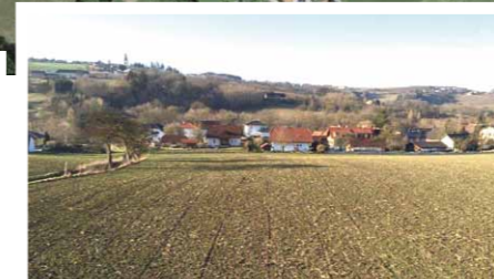
QR-Code scannen und auf Google Maps ansehen!